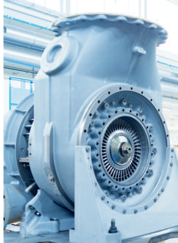
ABB Turbo Systems AG

Die Lizenzkosten zur Nutzung von DORIS betragen einmalig 2.000,- EUR sowie 1.000 EUR jährlich bei bis zu fünf Nutzern an einem Firmenstandort. Weitere Standorte mit wiederum bis zu fünf Nutzern kosten zusätzlich 500 EUR p.a., weitere Nutzer jeweils 150 EUR p.a. Der Betrag beinhaltet eine ausführliche Schulung durch unseren Dienstleister. Die Lizenznehmer haben zudem die Möglichkeit sich im VDMA Arbeitskreis Klassifikation regelmäßig über die Rules und die Datenbank mit anderen Unternehmen auszutauschen. Für Interessenten bieten wir einen kostenfreien, dreimonatigen Schnupperzugang an.